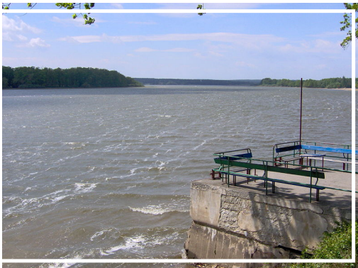
rybník Svět (Třeboň)