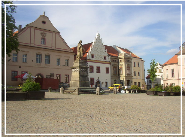
pomník Jana Žižky

Byl založen na jaře roku 1420 husity a pojmenován podle hory Thabor.